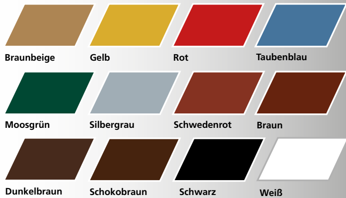
Braunbeige Gelb Rot Taubenblau Moosgrün Silbergrau Schwedenrot Braun Dunkelbraun Schokobraun Schwarz Weiß